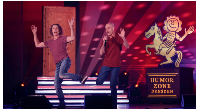
Die Umbilical Brothers aus Australien gehörten zu den Publikumsbeliebten der achten Dresdner Humorzone.

Trotz Corona-Beschränkungen ziehen die Veranstalter nach fünf Tagen Lachmuskul-Training ein positives Fazit. Schirmherr Olaf Schubert freut sich schon auf die Fortsetzung.