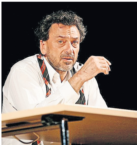
Der 2019 verstorbene Olaf Böhme, wie ihn seine vielen Fans liebten: in seiner Paraderolle als „betrunkenen Sachse“.

einzelne Stationen in der Karriere des so ungemein populären sächsischen Kabarettisten, Autors und Schauspielers, die Anfänge Böhmes in der freien Theatergruppe „Spielbrett“, seine Verdienste um das „theater 50“ in Löbtau. Auch trägt er Glanzstücke aus dem Schaffen Böhmes vor. Kaufmann liest wie einst die Kultfigur von sächsischem Schrot und Korn mit lallendem Zungenschlag im mittlerweile aus der Zeit gefallenen Telefonbuch. Auch zitiert er einzelne Gedichte, die sich durch einen feinen